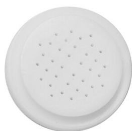
cabelo de anjo