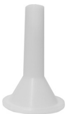
Funil de Nylon Curto

Utilizado para fazer salame ou linguiça Disponível: nº 05, 08, 10 ou 22;