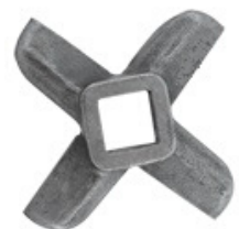
Navalha do Bocal

Utilizado para cortar a carne dentro do bocal Disponível: nº 05, 08, 10 ou 22;