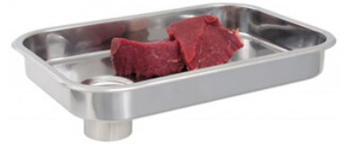
Bandeja de Metal

Utilizado para depositar carne Disponível: nº 22;