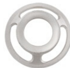
Volante do Bocal

Utilizado para fixar peças do conjunto bocal