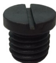
Pino de Massa

Utilizado a fixar peças do conjunto bocal