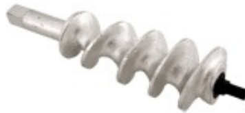
Caracol do Bocal

Utilizado para empurrar a carne, massa ou bolacha de dentro do conjunto bocal Disponível: nº 05, 08, 10 ou 22;