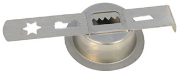
Bolacheira de Metal

Utilizado para fazer bolacha Disponível: nº 05, 08, 10 ou 22;