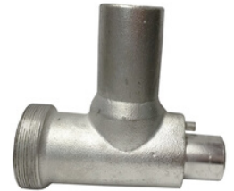
Carcaça do Bocal

Utilizado para moer carne ou extrusar massa e bolacha Disponível: nº 05, 08, 10 ou 22;