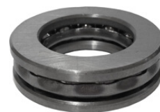
Rolamento do Caracol

Utilizado para fazer o encosto no caracol do conjunto bocal