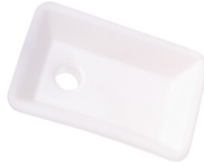
Bandeja de Nylon

Utilizado para depositar carne ou massa Disponível: nº 05, 08, 10;